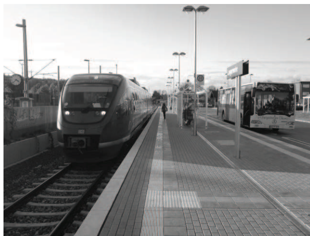
Euregiobahn im Bahnhof Langerwehe, Foto: (c) Michael Bienick

schen Langerwehe und Weisweiler gezwungen, die Euregiobahn zu nutzen. Je nach Start- und Zielpunkt müssen die Fahrgäste dabei erhebliche Fußwege in Kauf nehmen, da die Bahn naturgemäß wesentlich seltener hält. Fahrgäste, die über Weisweiler und Langerwehe hinaus auf den Bus angewiesen sind, werden nun gleich zweimal zum Umsteigen gezwungen. Will man z. B. von Schlich in die östlichen Stadtteile von Eschweiler fahren, muss man in Langerwehe vom Bus in den Zug und in Weisweiler wieder vom Zug in den Bus umsteigen.