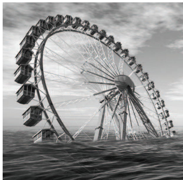
Motiv für die Region Düren

Beim Kreis Dürener Motiv symbolisiert ein in den Fluten einstürzendes Riesenrad die dort jährlich stattfindende über die Region hinaus bekannte Annakirmes.