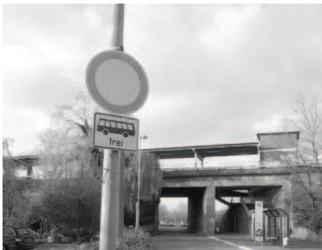
Bahnhof Hückelhoven-Baal

nun eine Unterbrechung von lediglich ca. zwei Kilometern. „Eine solche Lücke kann man keinem Fahrgast sinnvoll erklären“, meint Houbertz. PRO BAHN befürwortet hier schon seit Jahren die Durchbindung der Linie 006 über Wanlo hinaus bis Erkelenz. Diese Maßnahme könnte durch die NVV mit nur einem zusätzlichen Fahrzeug umgesetzt werden. Da auf diese Weise die neue Linie EK 3 überflüssig wäre, könnte diese Maßnahme ohne wirkliche Mehrkosten realisiert werden. Und den Bewohnern der östlichen Stadtteile von Erkelenz würde zusätzlich eine umsteigefreie Verbindung in Richtung Rheydt angeboten. Hinzu kommt, dass die Fahrzeiten der Linien EK 1, EK 2 und EK 3 jetzt derart ungünstig sind, dass in Erkelenz teilweise Zuganschlüsse ganz knapp verpasst werden.