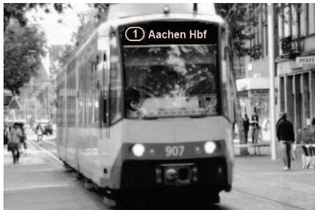
So könnte eine Stadtbahn in Aachen aussehen

Straße genügend Platz für ein eigenes Gleisbett der Campusbahn biete“, so Appel.